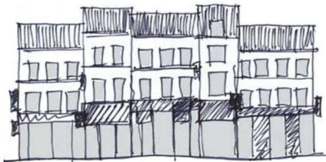
Principe de l'abaissement des trumeaux d'anciens rez-de-chaussée commerciaux.