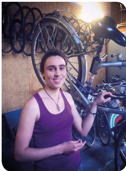
Comme Marine, grâce à l'Atelier Biciklo, vous aurez un vélo comme neuf, à petit prix et tout ça en apprenant à le réparer !