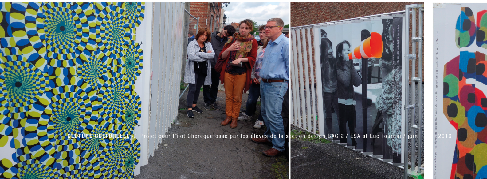
CLÔTURE CULTURELLE // Projet pour l'îlot Cherequefosse par les élèves de la section design BAC 2 / ESA st Luc Tournai / juin

L. : Les liens se maintiendront. On a concrétisé ce que souhaitent les habitants, on pourra encore se réunir, poser des questions. J'ai vécu de très belles choses. Il y a toujours des personnes intéressées à se mobiliser. Si on va vers les gens, si on agit, tout est possible même si les réticences existeront toujours... J'ai confiance dans les gens ! ■