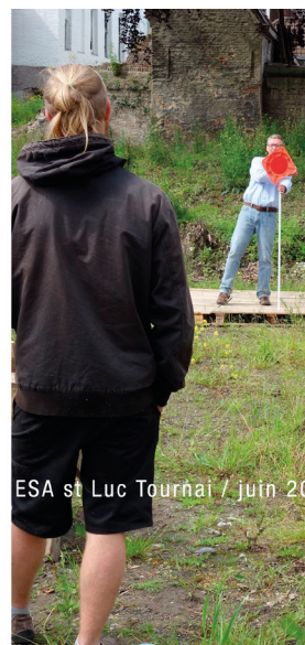
ESA st Luc Tournai / juin 2016