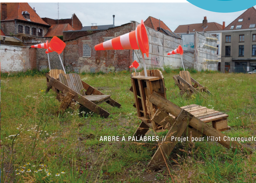
ARBRE À PALABRES // Projet pour l'îlot Cherequefosse par les élèves de la section design BAC 2 /