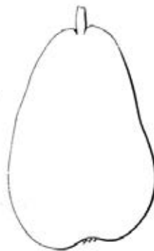
24. — Beurré de Germigny.